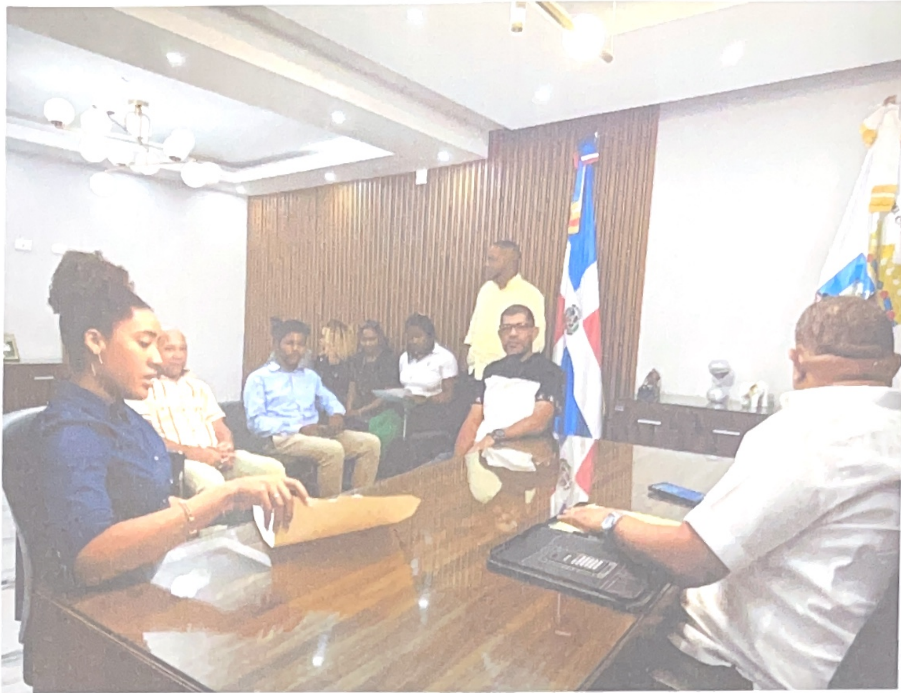
Evidencias del encuentro durante el taller de la comisión técnica de seguimiento del sismap con miras a la creación del PMD.